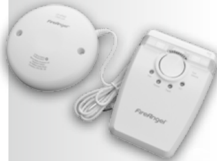
W2-SVP-630 Blitzlicht mit Vibrationskissen

Das kombinierte Blitzlicht und Vibrationskissen W2-SVP-630 gewährt speziell Gehörlosen, Schwerhörigen und Kindern ein Höchstmaß an Sicherheit. Das Blitzlicht und Vibrationskissen werden gleichzeitig aktiviert, wenn diese von einem Rauchmelder ein Alarmsignal empfangen.